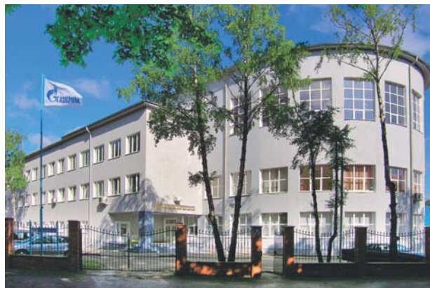
Здание ЧУ ДПО «Газпром ОНУТЦ»

▪ реализация учебных программ повышения квалификации и профессиональной переподготовки (на базе учебного центра в Калининграде и в выездном формате на базе образовательных подразделений дочерних обществ ПАО «Газпром»);