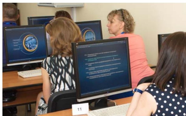
Обучение на ИОС