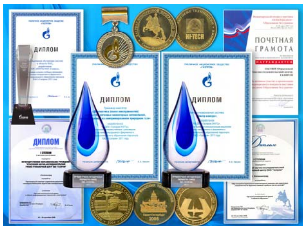
Награды ЧУ ДПО «Газпром ОНУТЦ»