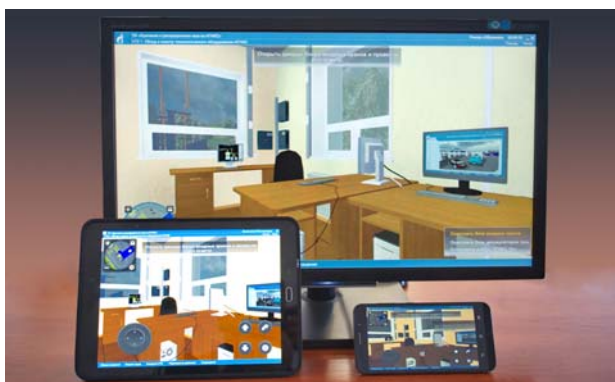
Интерактивные обучающие системы на разных устройствах

Для организации и проведения учебного процесса ЧУ ДПО «Газпром ОНУТЦ» располагает конференц-залом и учебными аудиториями, оснащенными современными мультимедийными системами, компьютерной и оргтехникой, флипчартами, интерактивными досками, оборудованием для проведения сеансов видео-конференц-связи и вебинаров.